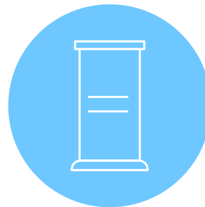
ESPACE POUR 1-2 ROLL-UP (fourni-s par l'exposant)